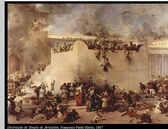
Destruição do Templo de Jerusalém, Francesco Paolo Hayez, 1867

A liturgia deste domingo reflete sobre o sentido da história da salvação e diz-nos que a meta final para onde Deus nos conduz é o novo céu e a nova terra da felicidade plena, da vida definitiva. Este quadro (que deve ser o horizonte que os nossos olhos contemplam em cada dia da nossa caminhada neste mundo) faz nascer em nós a esperança; e da esperança brota a coragem para enfrentar a adversidade e para lutar pelo advento do Reino.