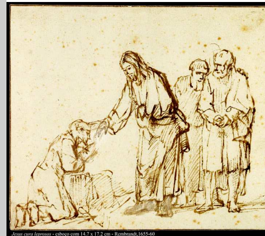
Jesus cura leproso - esboço com 14,7 x 17,2 cm - Rembrandt, 1655-60

A liturgia deste domingo mostra-nos, com exemplos concretos, como Deus tem um projeto de salvação para oferecer a todos os homens, sem exceção; reconhecer o dom de Deus, acolhê-lo com amor e gratidão, é a condição para vencer a alienação, o sofrimento, o afastamento de Deus e dos irmãos e chegar à vida plena.