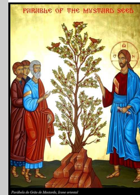
Parábola do Grão de Mostarda, Jesus ensinando

Na Palavra de Deus que hoje nos é proposta, cruzam-se vários temas (a fé, a salvação, a radicalidade do "caminho do Reino", etc.); mas sobressai a reflexão sobre a atitude correta que o homem deve assumir face a Deus. As leituras convidam-nos a reconhecer, com humildade, a nossa pequenez e finitude, a comprometer-nos com o "Reino" sem cálculos nem exigências, a acolher com gratidão os dons de Deus e a entregar-nos confiantes nas suas mãos.