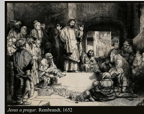
Jesus a pregar. Rembrandt, 1652

A liturgia deste domingo convida-nos a tomar consciência de quanto é exigente o caminho do "Reino". Optar pelo "Reino" não é escolher um caminho de facilidade, mas sim aceitar percorrer um caminho de renúncia e de dom da vida.