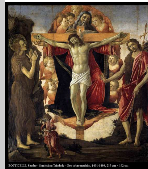
BOTTICELLI, Sandro - Santissima Trinitade - óleo sobre madeira, 1491-1493, 215 cm x 192 cm

A Solenidade que hoje celebramos não é um convite a decifrar a mistério que se esconde por detrás de “um Deus em três pessoas”; mas é um convite a contemplar o Deus que é amor, que é família, que é comunidade e que criou os homens para os fazer comungar nesse mistério de amor.