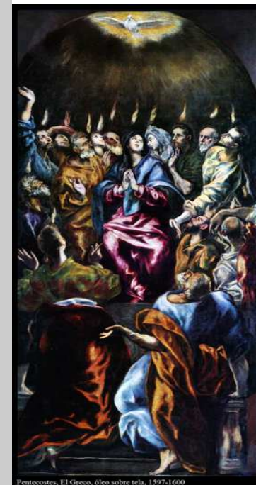
Pentecostes. El Greco, óleo sobre tela, 1597-1600

O tema deste domingo é, evidentemente, o Espírito Santo. Dom de Deus a todos os crentes, o Espírito dá vida, renova, transforma, constrói comunidade e faz nascer o Homem Novo.