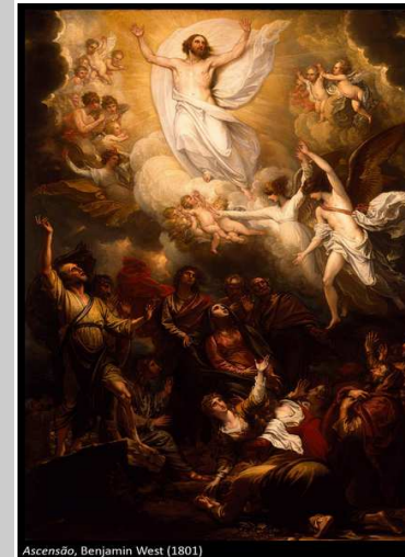
Ascensão, Benjamin West (1801)

A Solenidade da Ascensão de Jesus que hoje celebramos sugere que, no final de um caminho percorrido no amor e na doação, está a vida definitiva, em comunhão com Deus. Sugere, também, que Jesus nos deixou o testemunho e que somos agora nós, seus seguidores, que devemos continuar a realizar o projeto libertador de Deus para os homens e para o mundo.