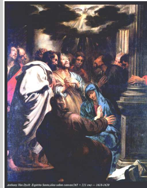
Anthony Van Dyck: Espírito Santo, óleo sobre canvas (265 x 221 cm) — 1618-1620

Na liturgia deste domingo sobressai a promessa de Jesus de acompanhar de forma permanente a caminhada da sua comunidade em marcha pela história: não estamos sozinhos; Jesus ressuscitado vai sempre ao nosso lado.