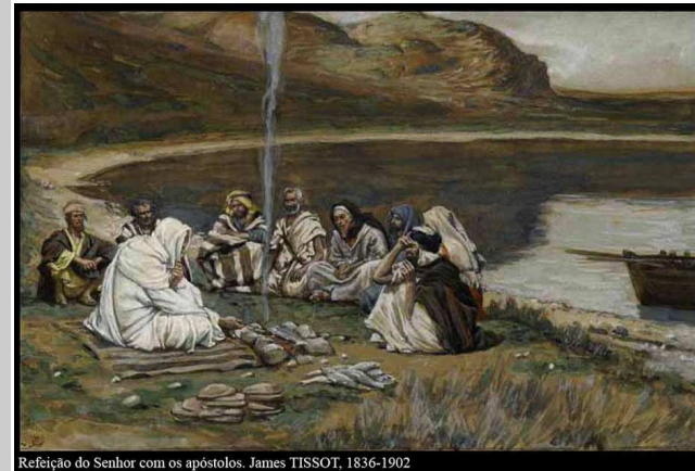
Refeição do Senhor com os apóstolos. James TISSOT, 1836-1902

A liturgia deste 3º Domingo do Tempo Pascal recorda-nos que a comunidade cristã tem por missão testemunhar e concretizar o projeto libertador que Jesus iniciou; e que Jesus, vivo e ressuscitado, acompanhará sempre a sua Igreja em missão, vivificando-a com a sua presença e orientando-a com a sua Palavra.