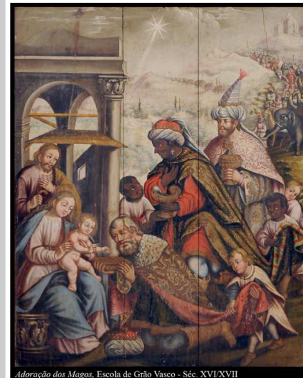
Adoração dos Magos. Escola de Grão Vasco - Séc. XVI/XVII

A liturgia deste domingo leva-nos à manifestação de Jesus como “a luz” que atrai a Si todos os povos da terra. Essa “luz” incarnou na nossa história, a fim de iluminar os caminhos dos homens com uma proposta de salvação/libertação.