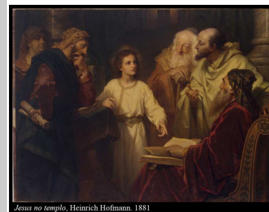
Jesus no templo, Heinrich Hofmann, 1881

As leituras deste domingo complementam-se ao apresentar as duas coordenadas fundamentais a partir das quais se deve construir a família cristã: o amor a Deus e o amor aos outros, sobretudo a esses que estão mais perto de nós – os pais e demais familiares.